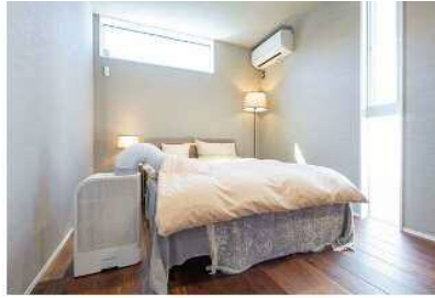
ベッド・布団乾燥に