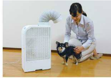
ペットのドライヤーとして