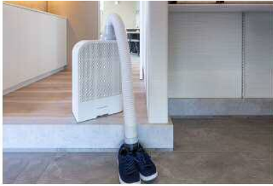
靴の乾燥・消臭に