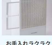
お手入れラクラク